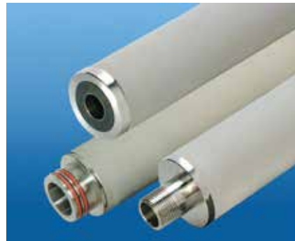
LOFMET-Filterkerzen sind mit verschiedenen Dichtungen und Adaptern verfügbar.

Nordamerika 44 Apple Street Tinton Falls, NJ 07724 Gebührenfrei: 800 656-3344 (nur innerhalb Nordamerikas) Tel: +1 732 212-4700